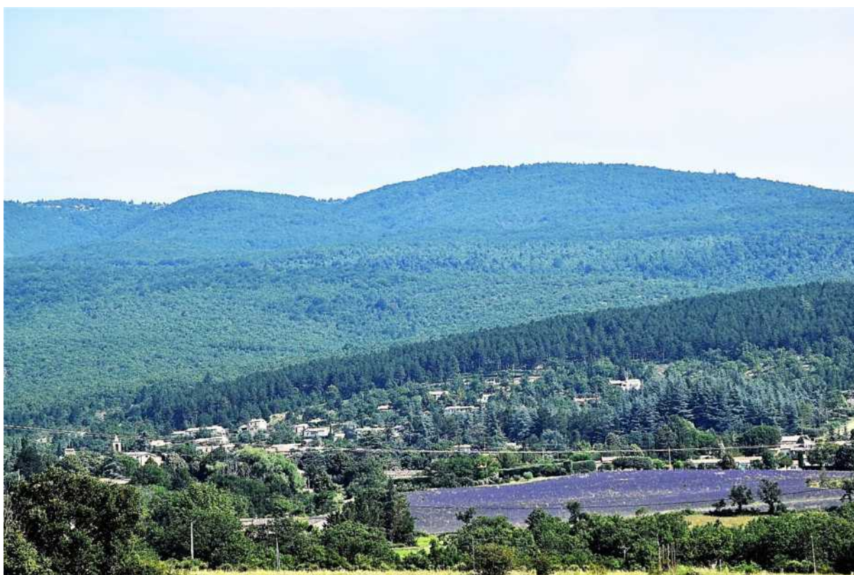
Photographies Juin 2023