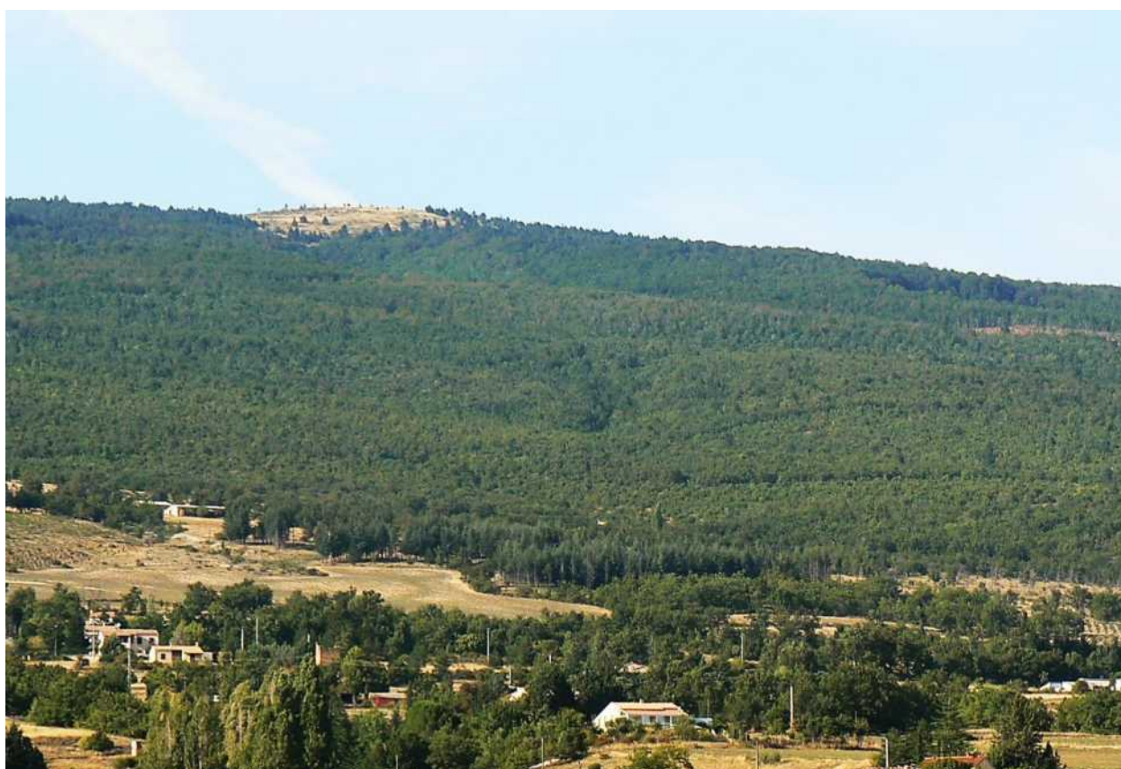
Photographies juin 2023