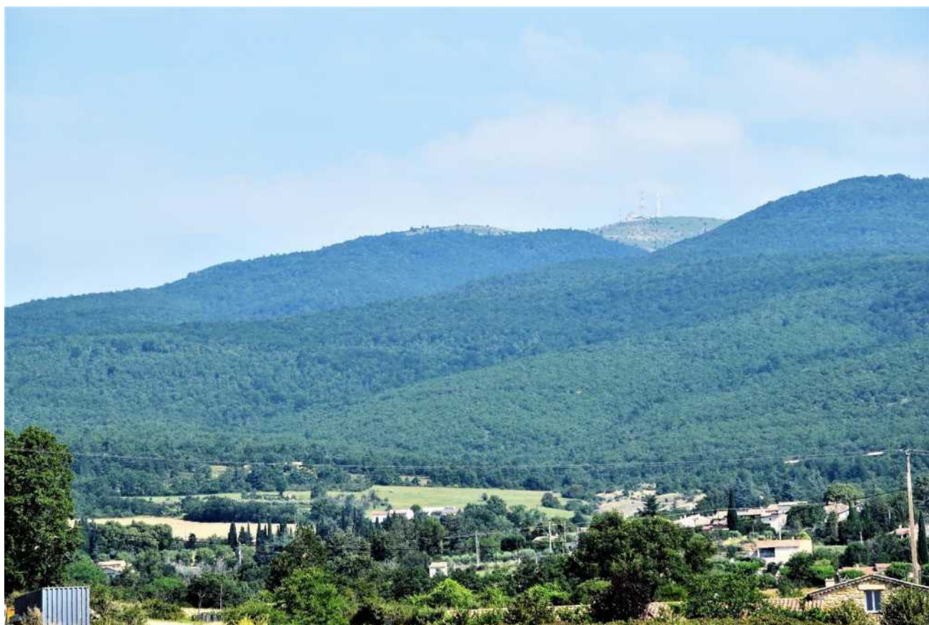
Photographie juin 2023

Au cours de votre lecture, les principaux équipements et aménagements réalisés tout au long de nos mandats vous seront exposés.