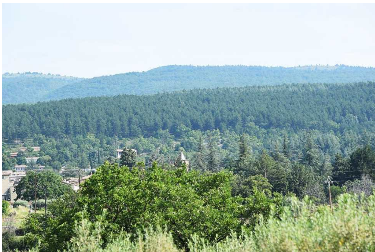
Photographie juin 2023