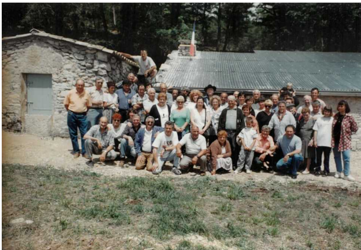
Inauguration du Jas de Roche

En constituant cette brochure et en regardant les photos, nous avons une affectueuse pensée pour plusieurs de nos amis qui nous ont quittés et qui ont participé à tous les travaux de restauration.